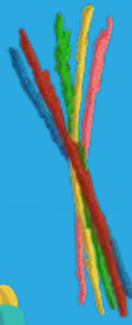
Limpiadores de pipa