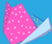
Papel de origami